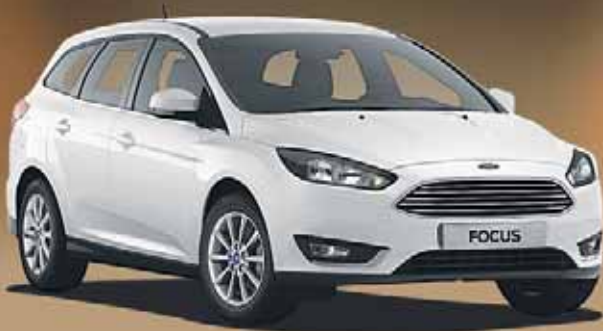
Abbildung zeigt Wunschausstattung gegen Mehrpreis.

Der Ford Focus Turnier als Tageszulassung.